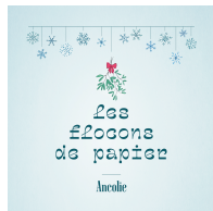
LES FLOCONS DE PAPIER Single 2021