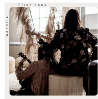
FILER DOUX Single 2021