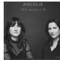
ME RENDRE À TOI Single 2019