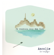
JE VOUDRAIS VOIR NEW YORK - acoustique Single 2021