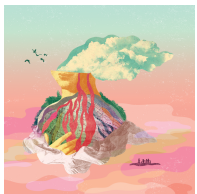
LES ÉBRANLEMENTS Album 2022