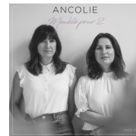
MEUBLÉ POUR DEUX Single 2019