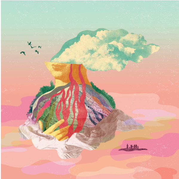
LES ÉBRANLEMENTS - 2022