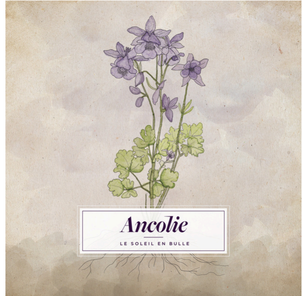
LE SOLEIL EN BULLE - 2018

Finaliste Auteur-compositeur francophone de l'année Prix de Musique Folk Canadienne (CFMA)